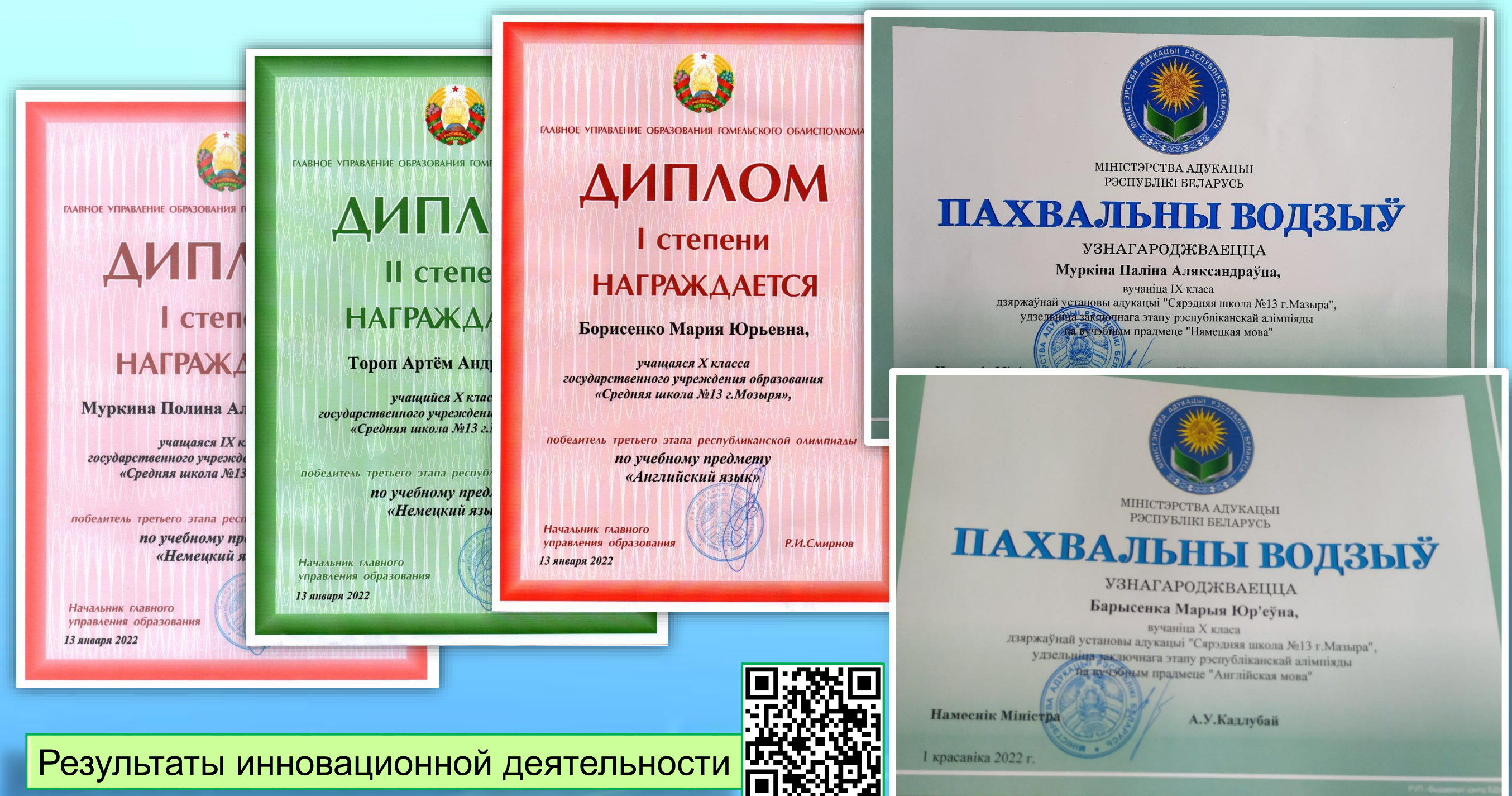
Результаты инновационной деятельности

Ожидаемые результаты внедрения модели: стратегии развития УО как Школьного сообщества СЭО, инструкции и методическое обеспечение СЭО, достижение результатов СЭО по развитию универсальных компетенций учащихся